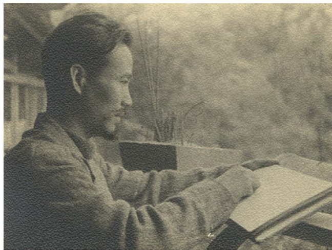
在四川青城山写生 1944年