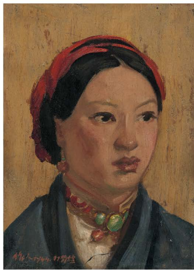
打箭炉少女 木板油画 30cm×22cm 1944年

在康定期间，为木家锅庄 [26] 的女主人作肖像画《打箭炉木女士像》 [27] （后习称《打箭炉少女》） [28] 。