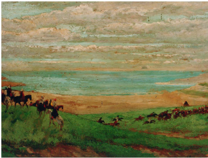
祭青海 木板油画 61cm×80cm 1943年

与同行入分手后暂住在艾黎的“工业合作社”宿舍，结识艾黎的朋友、“工合运动” [2] 的积极参与者乔治·何克 [3] 。在此完成油画《祭青海》的创作。 [4]