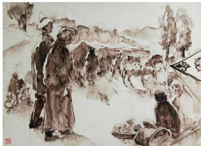
青海市场稿 纸质水墨 25.7cm×36.5cm 约1944年

经由庞薰琹结识英国人苏立文 [5] 及其妻子吴环。 在1943年油画稿《青海市集即景》的基础上，完成大幅油画《青海市场》 [6] 。 [7] 把油画《青海市集即景》赠送给苏立文和吴环。 [8]