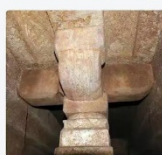
山东滕州市羊庄镇前毛德村东汉墓拱梁上枨柱、枨斗、栌斗、卷杀枅、小斗及替木结构组合