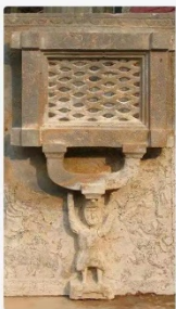
安徽萧县孙小林子晋墓出土胡人像柱础基石