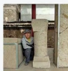
作者与山东平阴县东阿镇出土东汉石柱