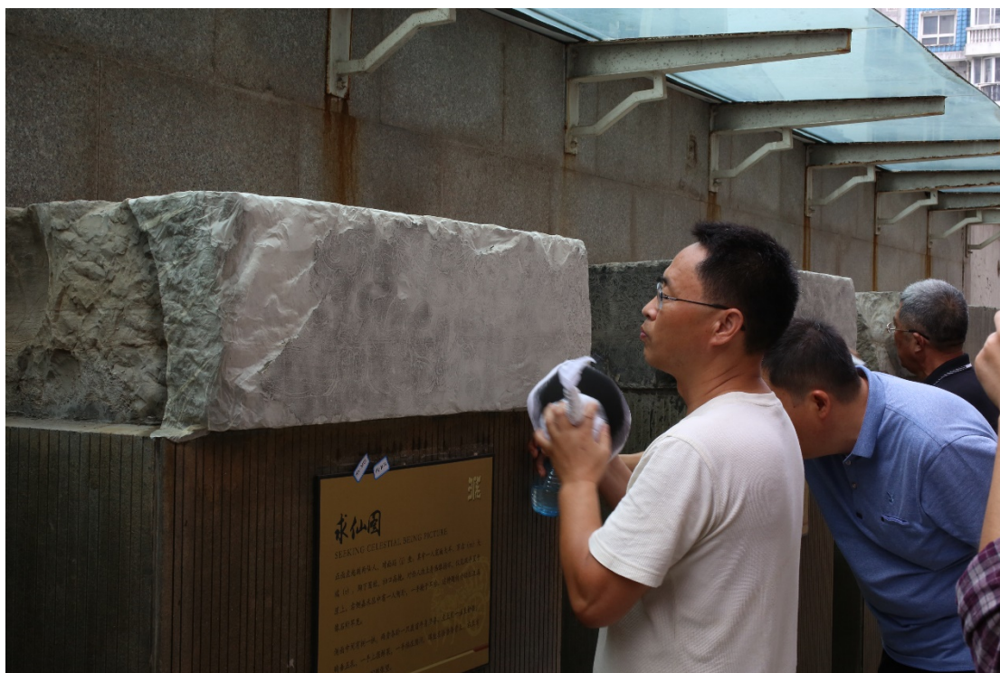
《汉画总录-淮安卷》现场图像采集拓片