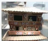
集作马村白庄墓区M121出土西汉晚期“四层彩绘”陶仓楼局部