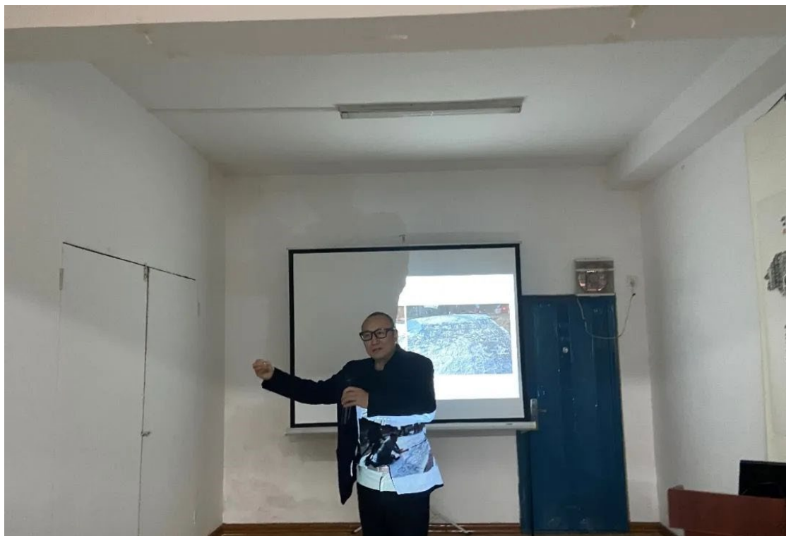
北京大学朱青生教授作学术总结