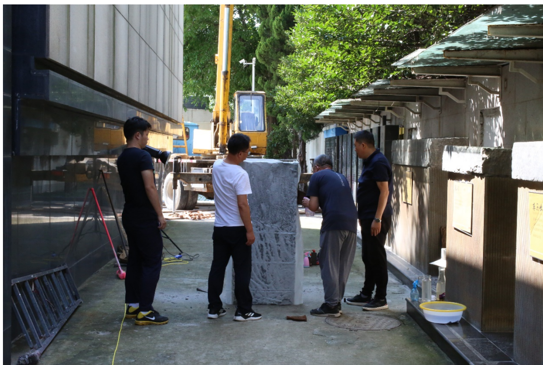
《汉画总录-淮安卷》现场图像吊取石刻采集拓片