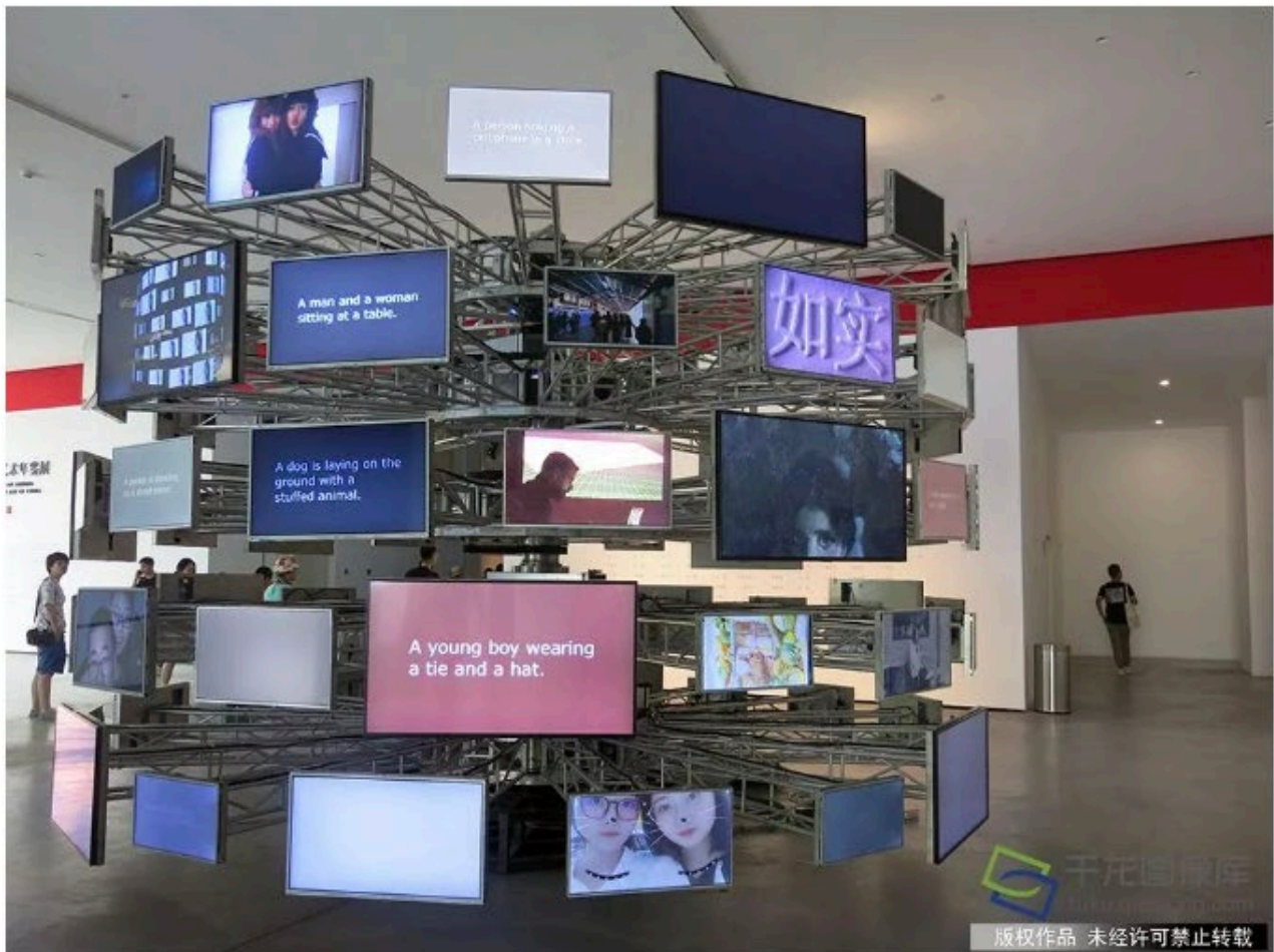
图为颜磊的影像装置《空想重置》。

6月25日，“中国当代艺术年鉴展2018”在北京民生现代美术馆开幕。展览通过“一年之鉴”这一时段性学术方法，系统性地呈现中国当代艺术在2018年的整体状况及趋势。