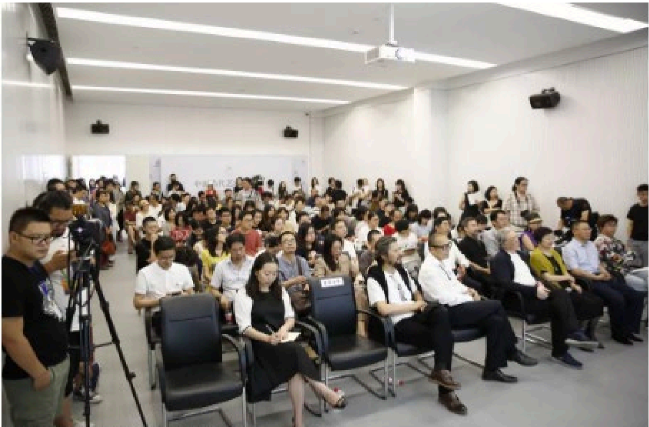
▲ “中国当代艺术年鉴展2018”开幕式现场

Aleph: 《年鉴展 2018 好在哪里? 如实反映中国当代艺术的症状》, 凤凰艺术, https://mp.weixin.qq.com/s/6iGlyxIGWb9Y6iFVpYpMng