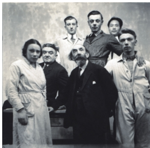
吴作人（后右一）和他的雕塑教师 卢梭教授（前左三）及部分同学合影