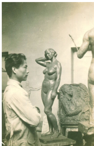
与雕塑作品合影 1932年