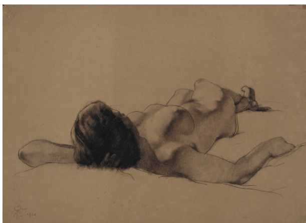
女人体 吴作人 1933 素描 51.2X68.5cm

1933年，在陪同徐悲鸿拜访当时比利时的画坛大师雷昂·弗雷德里克Léon Frédéric时，雷昂的一句话“你们中国有这么优秀而悠久的绘画传统，为什么要跑到这儿来学画西方的画？”引发吴作人对于中西方艺术差异的深思。